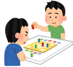
ボードゲーム大会