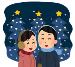
イルミネーション