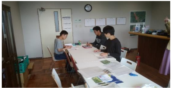
利用者ミーティングの様子