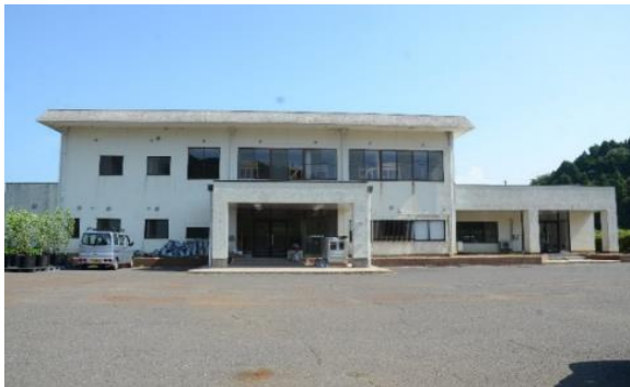
1次産業活動拠点施設(外観)