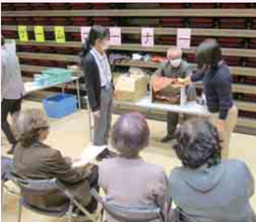
【ひとり暮らし高齢者のつどい ゲームコーナー】

翌26日（土）には、若狭瓦工事組合の会員によるボランティア活動として、ひとり暮らし高齢者宅の屋根の無料診断が行われました。