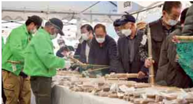
『じねんじょ祭り』が開催されました。町の特産品じねんじょを買い求めるお客さんで会場はおおいに賑わいました。(11月20日(日) 名田庄あきない館)