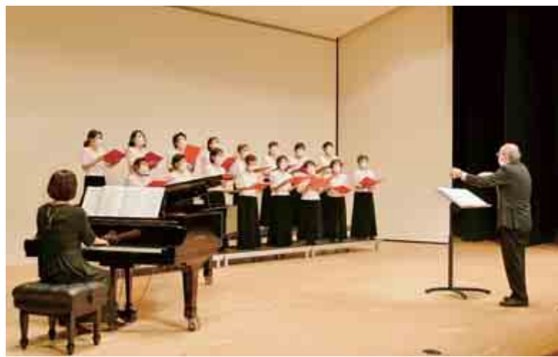
【里山まつり舞台発表の様子】

「スマイル」をテーマとした『おおい町民文化祭』が11月4日から11月6日までの期間総合町民センターで、3年ぶりに開催されました。会場には町民や各小・中学校からの展示作品が並び、来場者は一つ一つの作品の前で足を止めじっくりと鑑賞されていました。 また、大ホールでは文化協会の振興・発展に寄与された人たちの表彰する『おおい町文化協会表彰式』や『おおいなる詩コンクール表彰式』、各サークルによる舞台発表が行われました。完成度の高い発表や長年にわたる功績を讃え、客席からは大きな拍手が送られました。 また、『佐分利地区文化祭2022』が11月27日から12月4日佐分利公民館で、『し～まいる作品展』が大島公民館で11月24日から12月1日、『里山まつり2022』が10月17日から10月23日の期間名田庄公民館で開催されました。各公民館では作品展や舞台発表、ワークショップ体験、朗読会などさまざまな催しに来場者たちはおおいに盛り上がりました。