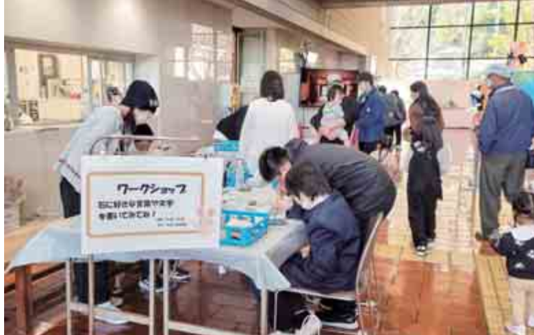
【おい町民文化祭 ワークショップ】