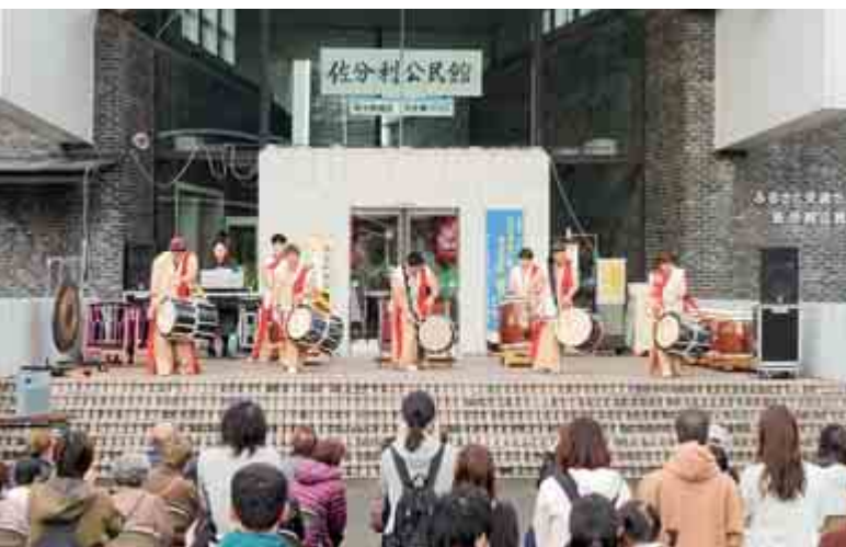
【佐分利地区文化祭 大飯ブレイズ太鼓演奏】