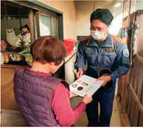
【ひとり暮らし高齢者への防火訪問】

高齢者等見守りネットワーク機関である若狭消防署大飯分署・名田庄分署と地域包括支援センターが連携して、秋の火災予防運動の一環として、ひとり暮らし高齢者世帯へ防火訪問と安否確認を行いました。