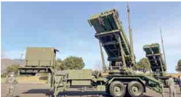
弾道ミサイル等を含む各種ミサイル対処に係る能力の維持・向上を図るため、航空自衛隊によるPAC-3等機動展開訓練が実施されました。(11月28日(月) 長井浜海水浴場)