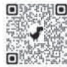
みち情報ネットワーク ふくいホームページ

自動車を道路上に放置すると除雪作業が大幅に遅れます。また放置駐車は法律の違反にもなりますのでしないでください。