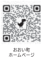
おい町ホームページ