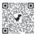
国税局 確定申告書等作成コーナー