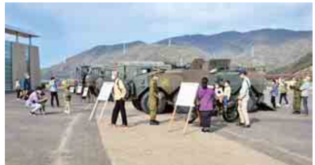
自衛隊福井地方協力本部の協力のもと、『自衛隊はたらく車大集合』が開催されました。参加した人たちは制服の試着や車両との写真撮影を楽しみました。(11月20日(日) こども家族館)