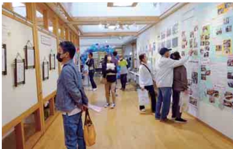
【里山まつり作品展示】