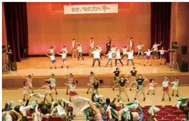
【おおい町民文化祭 新幹線開業ウェルカムダンスの様子】