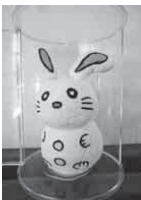
【紙粘土で作った干支の兔】

これからも、利用者様が楽しく過ごして頂けるような活動を通して、より良い在宅生活が送れるようにご支援させていただきます。