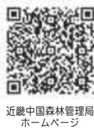
近畿中国森林管理局ホームページ