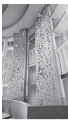
クライミングウォールなど楽しい設備が増えてリニューアルオープン

また、令和5年1月から3月までは全館閉館となります。みなさまにはご迷惑をおかけいたしますがよろしくお願いいたします。