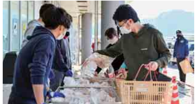
『カニまつり』が道の駅うみんぴあ大飯で開催されました。今年も大島で水揚げされたカニを求めて多くの人で賑わいました。(11月12日(土) 道の駅うみんぴあ大飯)