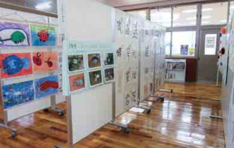
【し〜まいる作品展示】