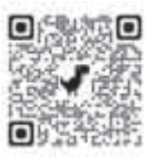
まちづくりアイデアコンテスト おおい町HP