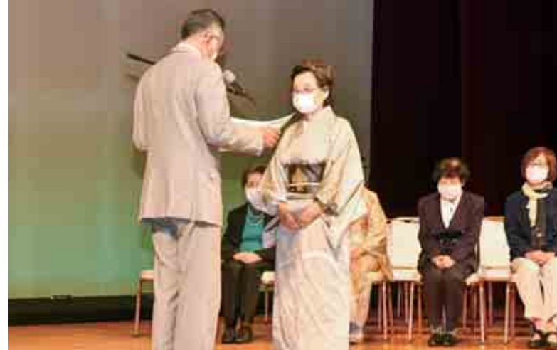
【おおい町文化協会表彰式】