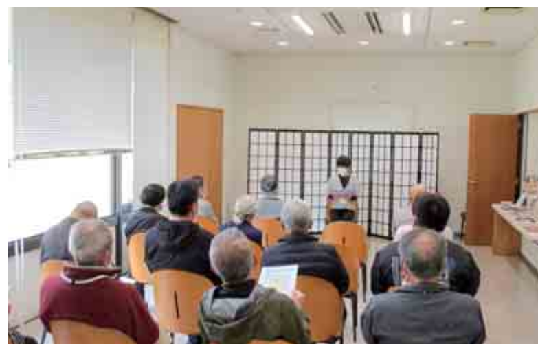
【佐分利地区文化祭 朗読会の様子】