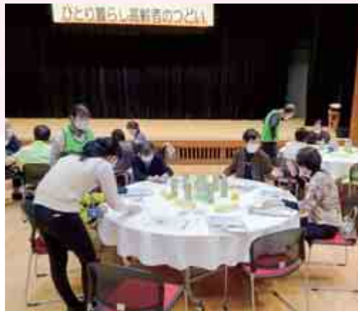
【ひとり暮らし高齢者のつどい フレイルチェック】