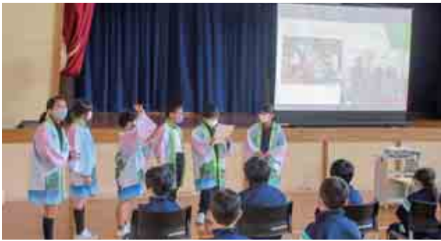
本郷小学校の4年生と若狭町梅の里小学校の3、4年生が、特産品の『梅』をきっかけに交流学習を行いました。児童たちは作成した梅ジュースと梅干しを交換し、学習発表を行いました。(11月11日(金) 梅の里小学校)