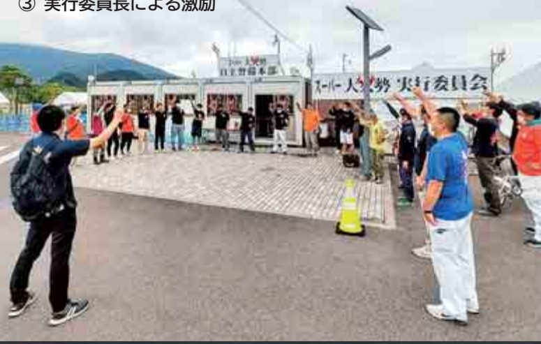
③ 実行委員長による激励