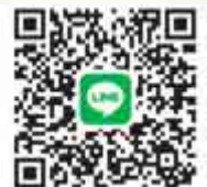
SEE SEA PARK 公式LINE