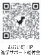
おい町 HP 進学サポート給付金