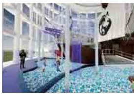
【2階リニューアルイメージ】