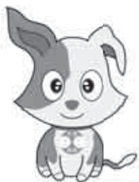
総務省行政相談センター