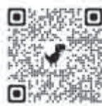
利用者登録用 QRコード