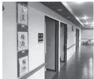
【お気に入りの作品を展示】

おい町保健・医療・福祉総合施設 介護老人保健施設 〒919-2111 おおい町本郷 92-51-1 TEL.77-3184 FAX.77-3388