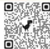
SEE SEA PARK 公式Instagram