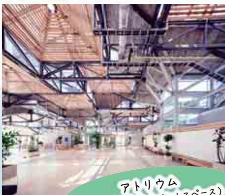
アトリウム (400㎡の屋内イベントスペース)

SEE SEA PARKは「みんなでつくる公園」をコンセプトにしており、皆さんにも発表会や展示会など各種イベントで施設（アトリウムや芝生広場）をご利用いただけます。興味のある人はぜひお問い合わせください。