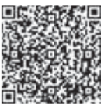
福井県HP 福井産食べて当てよう! キャンペーン開催中