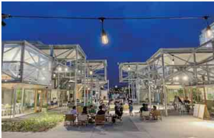
▲ NEW MOON MARKETの様子。毎月、開催を予定しています。

発熱や咳など、体調不良を感じたら、出勤・登校を控え、近隣の医療機関または新型コロナ総合相談センターに電話で相談 ☎ 0570-051-280