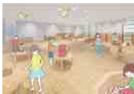
【1階リニューアルイメージ】