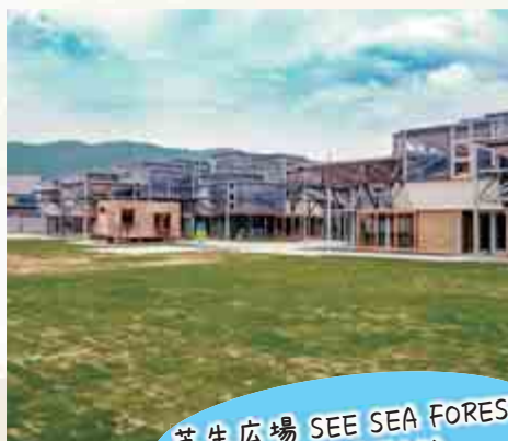
芝生広場 SEE SEA FOREST (屋外用電源あり)