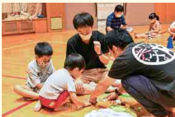
【折り紙を教わるパパたち】

パパが子どもと遊びながら子育てについて学べる教室「パパと子の教室」が、8月27日（土）にあみーシャン大飯で行われました。