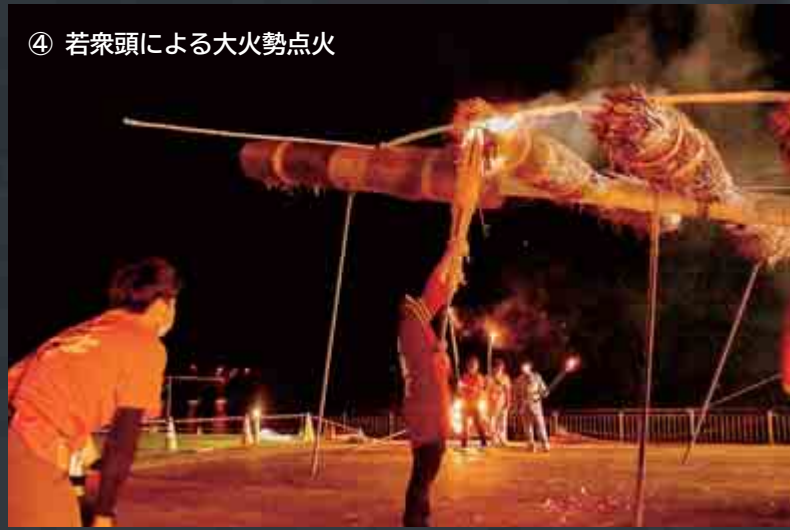
④ 若衆頭による大火勢点火