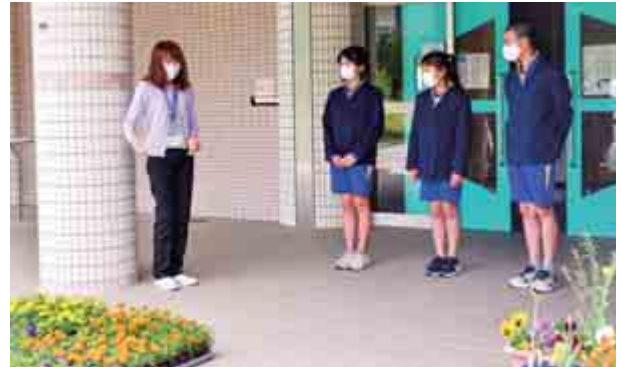
児童が協力して花を育てることで、優しさと思いやりの心を養うことを目的とした『人権の花運動』が町内各小・中学校で行われました。（5月11日（火） 佐分利小学校）