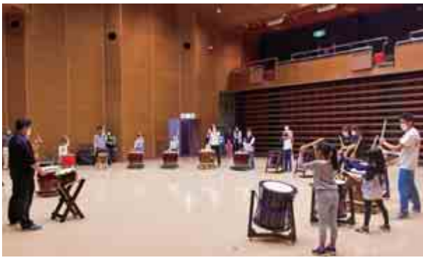
本郷公民館主催の『ニャン公塾（本郷子ども教室）』が行われました。第1回となる今回は、大飯ブレイズの皆さんを講師に太鼓教室を行いました。（5月1日（土） 総合町民センター）