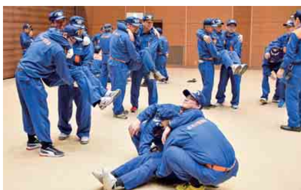
消防団の春季錬成会が行われ、身近なものを使用した救護グッズの作成法、担架を使用しない搬送方法などの救急救命の訓練を行いました。 (4月14日 総合町民センター)