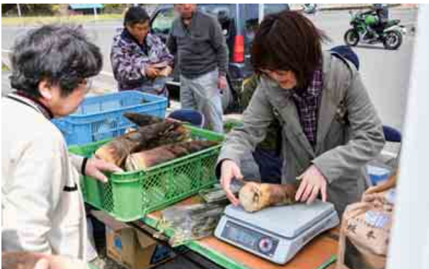
たけのこまつりが開かれました。大きなたけのこに驚いている方や、ふるまいたけのこご飯を食べ笑顔の方など賑やかなまつりとなりました。(4月28日 道の駅名田庄)