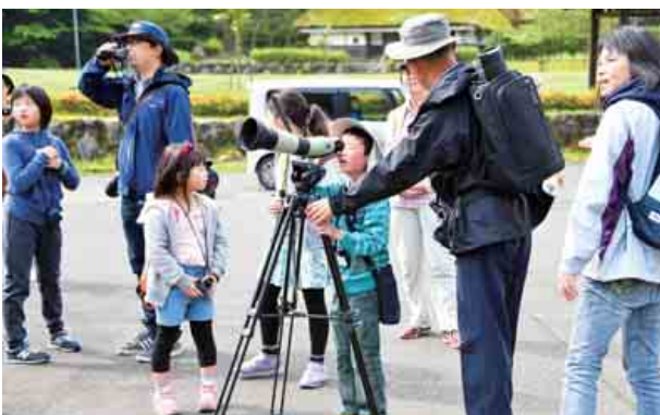
野山の散策と野鳥観察会が開かれました。参加者は、セキレイやヒヨドリなどのさまざまな野鳥の姿に目を輝かせていました。(5月3日 頭巾山青少年旅行村)