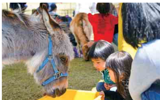
ごんせ! フェスティバル 2019 が開催され、参加者は、移動動物園や歌のパフォーマンスなど、盛りだくさんのイベントを満喫しました。 (4月13日、14日、20日、21日 きのこの森)