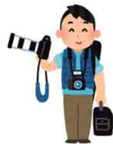
▲ 写真を提供してくださった愛鳥家さん(イメージ図)

野鳥の会の方から、珍しい鳥がおおい町に渡来したと伺い観察しに行きました。クロヅルの幼鳥とわかってからは、クロヅルを守るために、情報を公開しないように周辺住民の方々にお願いしました。皆さんのご理解もあって、落ち着いて過ごせているように見えました。長い間いるものだから、この土地が気に入ったのかな?とうれしく思いました。