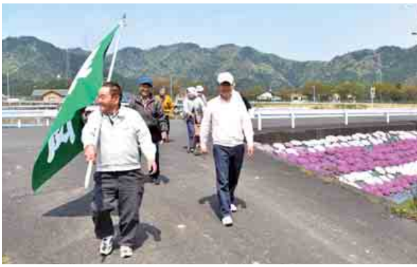
野尻区で芝桜鑑賞会が開かれました。区民が一丸となって、愛情いっぱい育てた芝桜が咲き誇りました。(4月20日 野尻区)