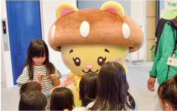
きのこの森公式マスコットキャラクター『くまっしゅ』が誕生しました。お披露目では、多くの子どもたちとふれあいました。(4月27日 きのこの森、こども家族館)