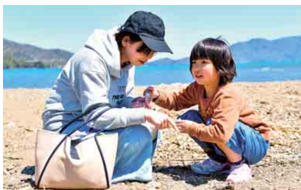
浜辺で貝殻などを拾うビーチコーミング体験と海の宝物ストラップづくりが開かれました。参加者は、ビーチコーミングで拾った貝殻やシーグラスをストラップに加工しました。 (4月13日、14日 佐分利川河口、こども家族館)