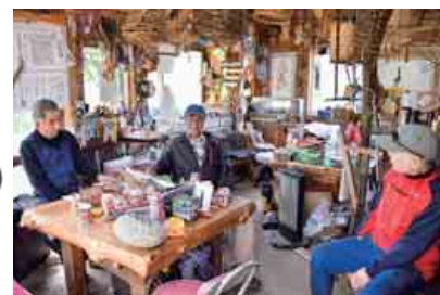
▲ クロヅルを見守った周辺住民の方々

昨年の11月中旬に見慣れない鳥がいると近所の人から連絡があり、すぐに見守るために行動しました。約300m四方の田んぼが行動範囲で、カラスやサギと一緒に、タニシやドジョウなどを食べていたことや草を空中に投げて遊んでいる姿が今でも鮮明に思い出せます。5か月も同じ場所にいるものだから、愛着もわいてしまって、飛び立つまでの日記には必ず「クロヅル、今日も健在」などとクロヅルが登場していました(笑)。