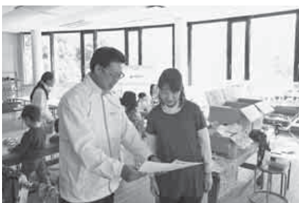
【ミニグライダーなどの作品】