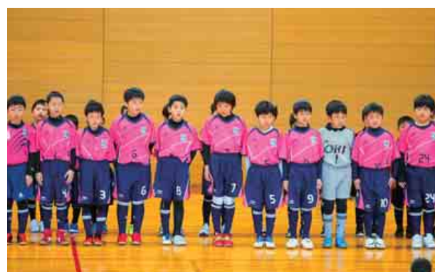
おおい町スポーツ少年団の結団式・春季大会が行われ、少年団ごとに団の紹介や今年の目標を発表しました。 (4月14日 総合運動公園体育館)