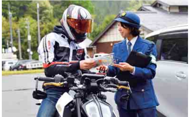
小浜警察署と京都府南丹警察署が共同で、道の駅を利用していただドライバーの方々に交通安全を呼びかけました。(4月26日 道の駅名田庄)