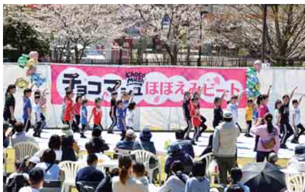
チョコマシュほほえみビート 2019 春が開催されました。さまざまな曲に合わせて踊る『チョコマシュ』のメンバーらは、日頃の練習の成果を発揮し、会場は大盛況でした。 (4月13日 船岡製塩遺跡公園)