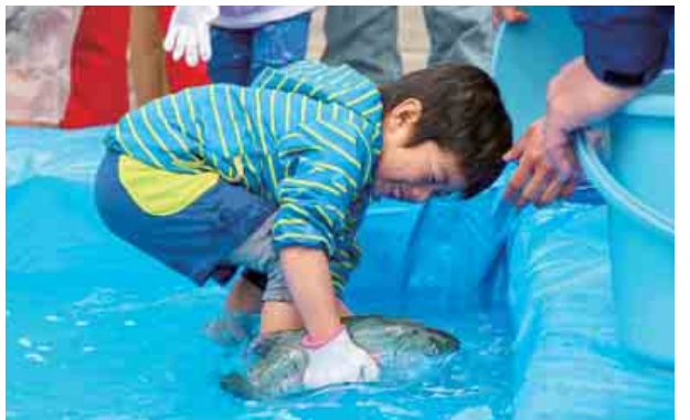
大漁市が開かれ、参加者は、ふくいサーモンのつかみ取りや新鮮な魚介類のせり市を楽しみました。(4月27日 うみんびあ大飯)