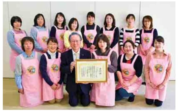
『おい町食いいきいき隊』が、長年の地域に根差した食生活改善活動が認められ、日本公衆衛生協会会長より公衆衛生事業功労者表彰を受けたことを町長に報告しました。(4月17日 なごみ)