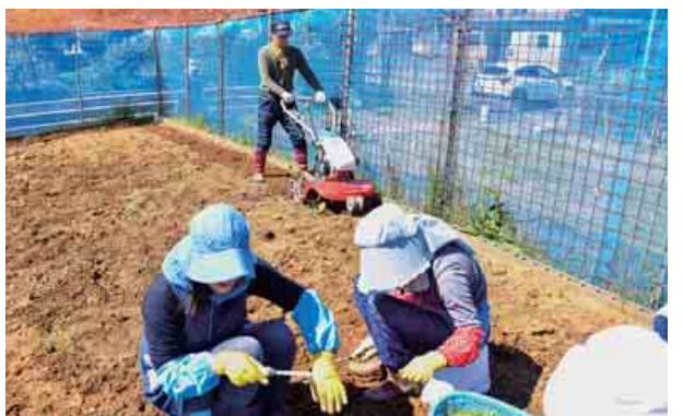
生涯学習推進事業の一環として、今年もし～まいる農園で農作業が始まり、丁寧に作土を行いました。できた野菜は小規模多機能ホーム『びわの木』に寄付されるなどの予定です。(4月13日～5月3日 し～まいる)