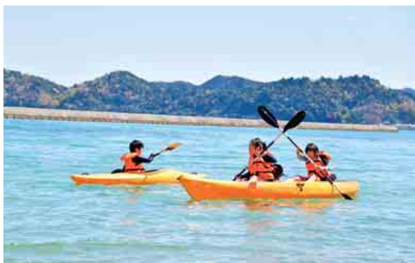
今年もおおいビーチクラブの活動が始まりました。晴天の中、参加者たちは、元気いっぱいにシーカヤックなどのマリンスポーツを体験しました。 (4月13日 長井浜海水浴場)