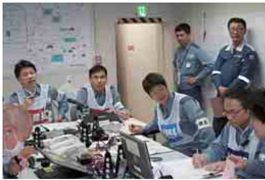
非常災害対策本部