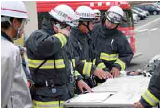
公設消防隊への引継ぎ

この他にも新規基準に対応した様々な訓練や、関係機関との連携を密にした訓練を行い、今後一層の充実を図ってまいります。