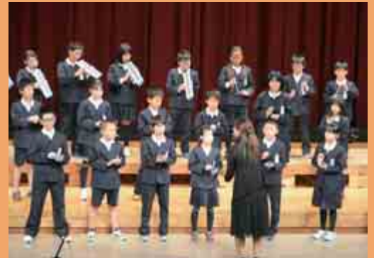
「大飯郡小中学校合同音楽会」 (総合町民センター 11月14日)