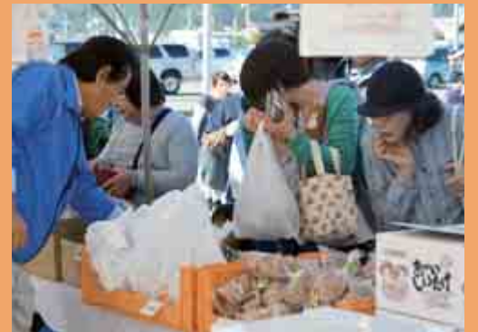
「きのこまつり」 (道の駅うみんびあ大飯 10月18日)