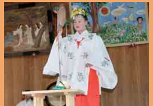
「日枝神社秋季例大祭」 (日枝神社 10月18日)