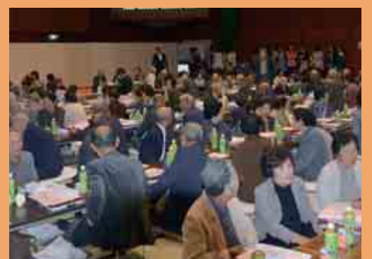
「名田庄地域 敬老会」 (流星館コンベンションホール 10月18日)