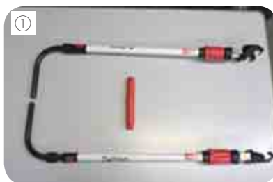
① JINRIKI QUICK ②装着イメージ