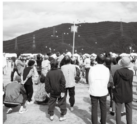
名田庄地域からの参加もあった町民体育大会

問 教育関係として、給食・青少年健全育成・図書館などの新規事業をアプローチしては。