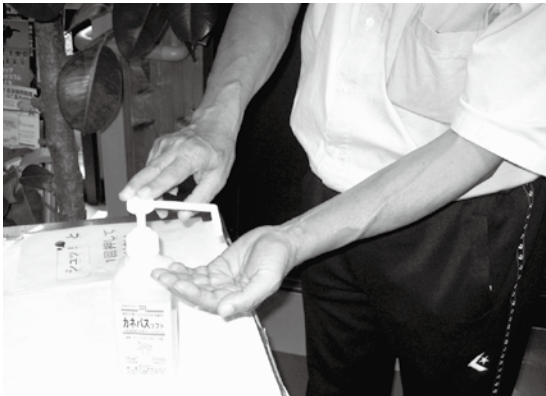
消毒液による感染予防対策

答 (総務課長) 補正予算を組むなどして、幼稚園・保育所・小中学校には、心配をかけるように十分な対応をしています。