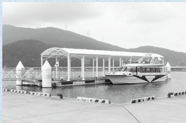
観光船事業がスタートした成海棧橋