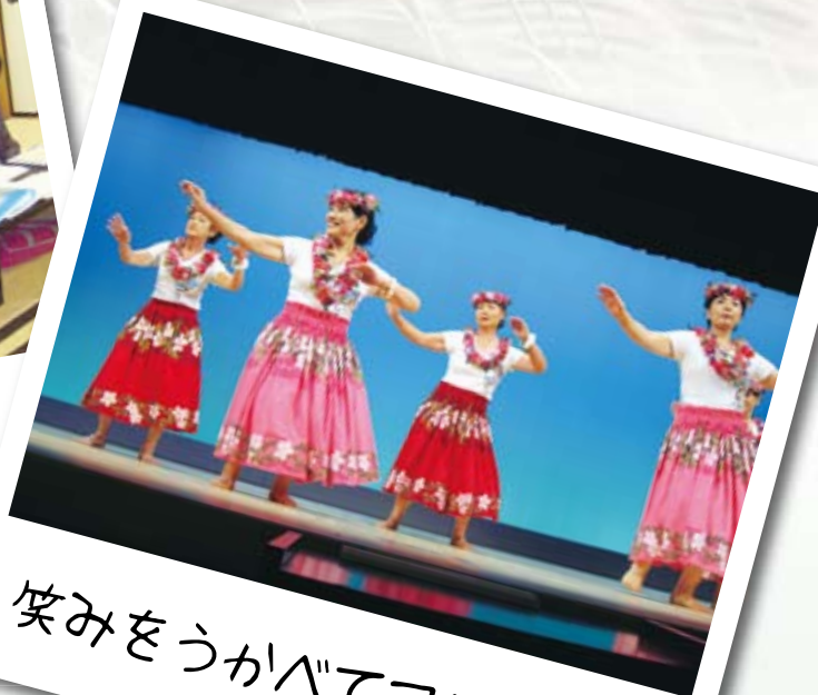
笑みをうかべてフラダンス