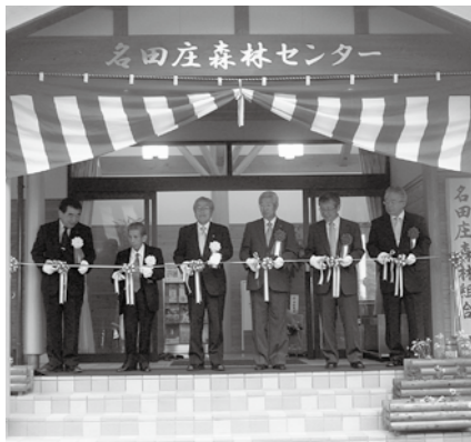
10月6日に行われた竣工式の様子

● デジタルX線TVシステム機器、超音波画像診断装置の購入 名田庄診療所の医療機器を最新のものに更新。(全会一致承認)