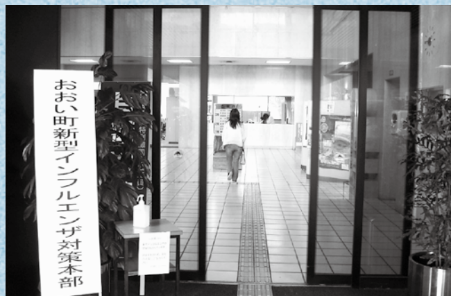
役場に設置された対策本部

本年4月に「おおい町新型インフルエンザ情報連絡会議」が、5月には「新型インフルエンザ対策本部」が設置されました。