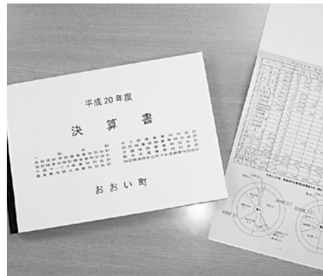
審査に付された平成20年度決算

また、一般会計および9特別会計歳入歳出決算は予算決算常任委員会に付託して審議し委員長からの報告の後、賛成多数で認定しました。