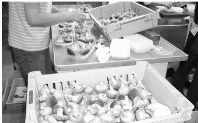
シイタケの選別作業の様子

今後は、利益配分など経営状況の透明性に努め、健全な状態にして会社運営を図ることが最優先と考えています。