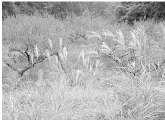
面積が拡大している放任梅園

答 (副町長) 放任梅園の面積は、10 ha 余りまで拡大し、梅園全体の面積は18 ha まで減ってきています。