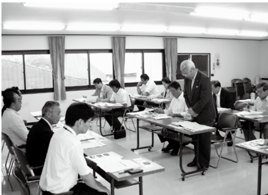
白老町での研修の様子

発想の転換と知恵の結集のまちづくりで大いに参考になりました。今回の研修で、町の存続に危機感をもって取り組んでいる姿勢を学び、今後の活動に生かしていきます。