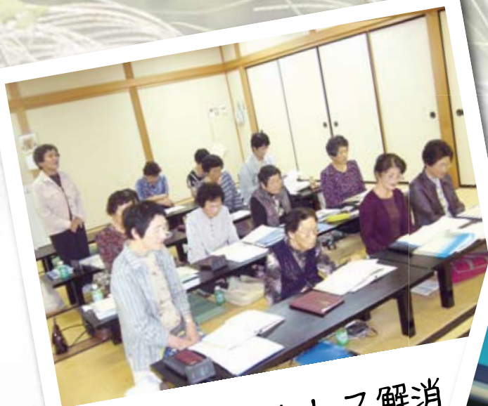
詩吟でストレス解消