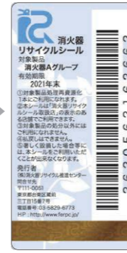
新品用シール（見本）

製品にはリサイクルシールが貼られています。耐用年数を過ぎたら、取扱い窓口へ引き渡してください。