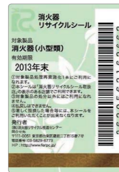
既製品用シール（見本）